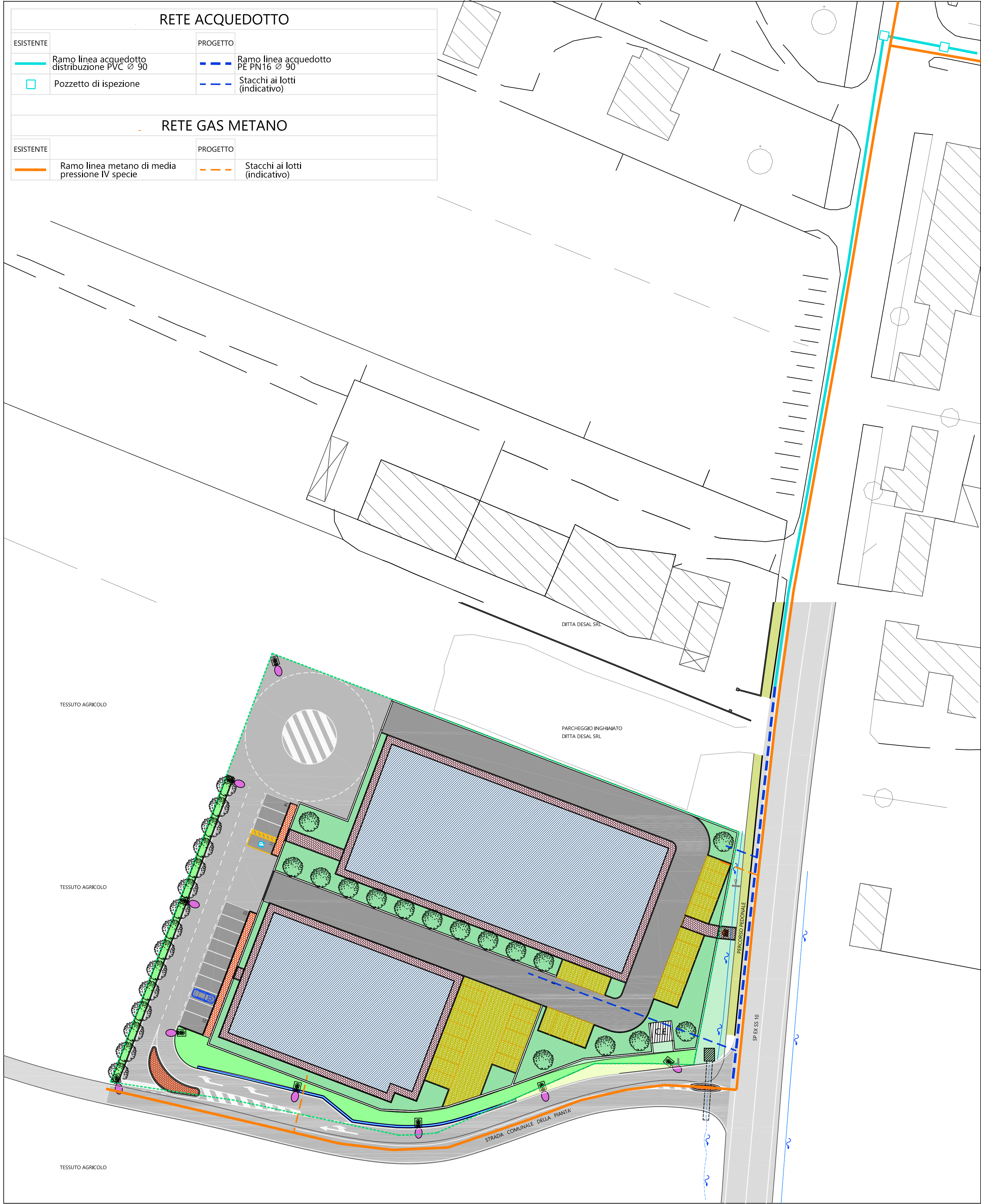
Reti acquedotto e gas